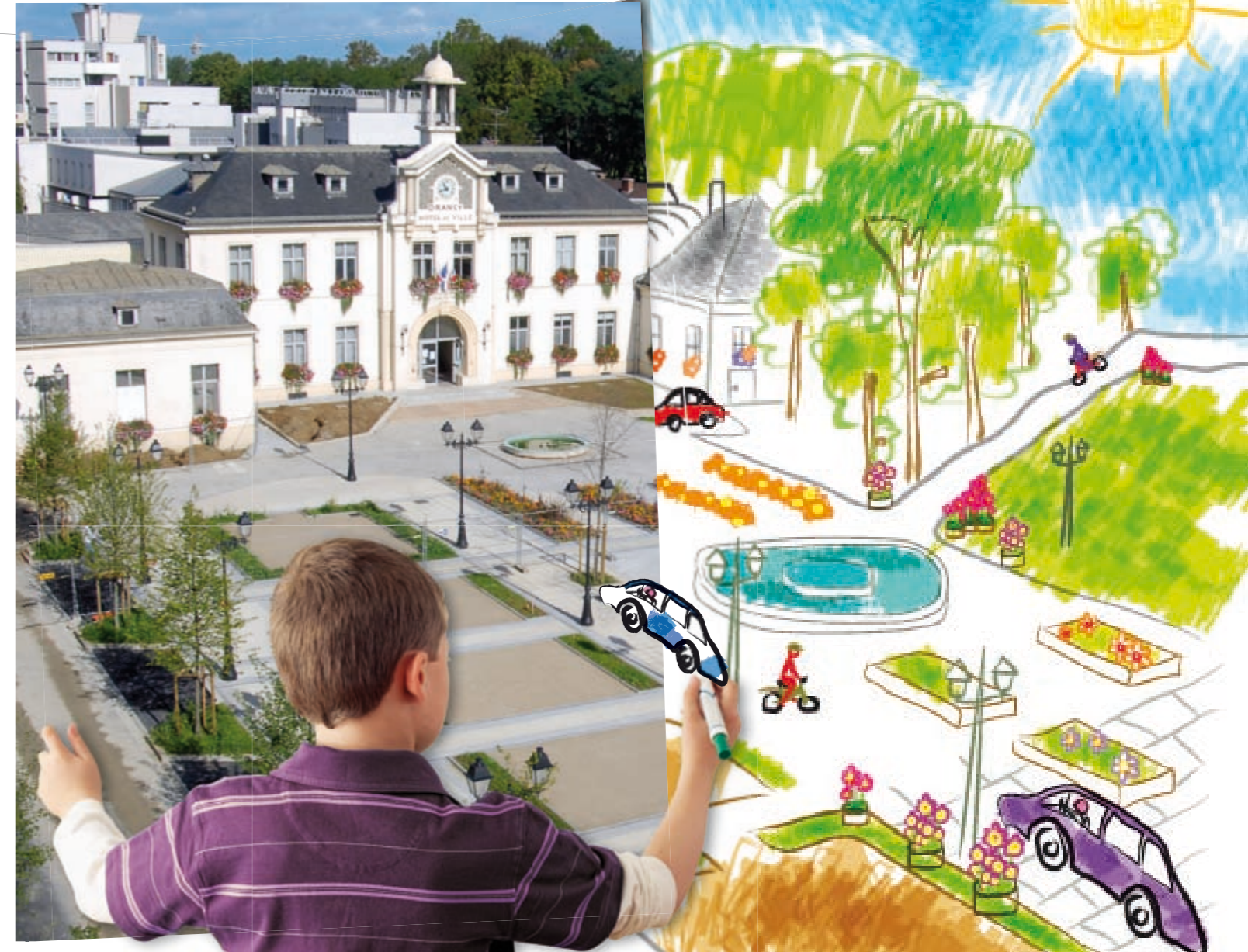
Colas - anesay.com - 05/10 - 5816

Sacer Sud-Est Echangeur 2, avenue Tony Garnier 69363 Lyon Cedex 07 Tél. : 04 37 65 53 90 Fax : 04 72 73 01 65